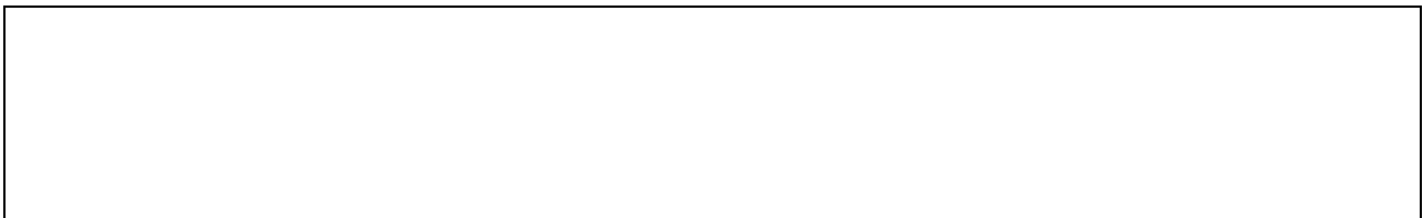
Схема споруди робиться на вклейці до бланка № 11

На поздовжньому та поперечному розрізах відображаються також лотки, штольні, шахти, а в необхідних випадках – окремі схеми дренажних проходок.